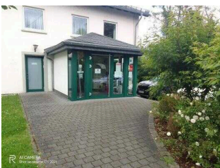
Eingang zur Touristinformation