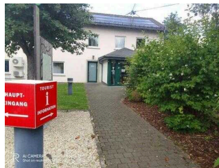
Eingang zur Touristinformation