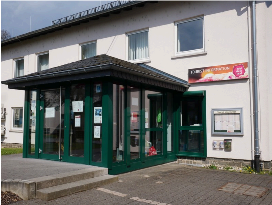
EdelSteinLand Tourist-Information Herrstein Eingangsbereich