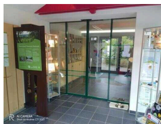
Eingang zur Touristinformation